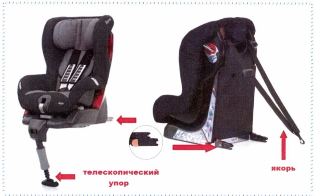
Рисунок 6. Телескопический упор и якорное крепление

Телескопический упор и якорное крепление разработаны специально для того, чтобы в момент столкновения снизить нагрузку на основное крепление детского автокресла, избежать возможности «клюющего» движения при лобовом столкновении и этим обеспечить более высокую безопасность в аварийных ситуациях.