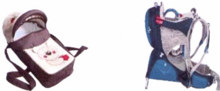
Люлька-переноска не предназначена для автомобиля