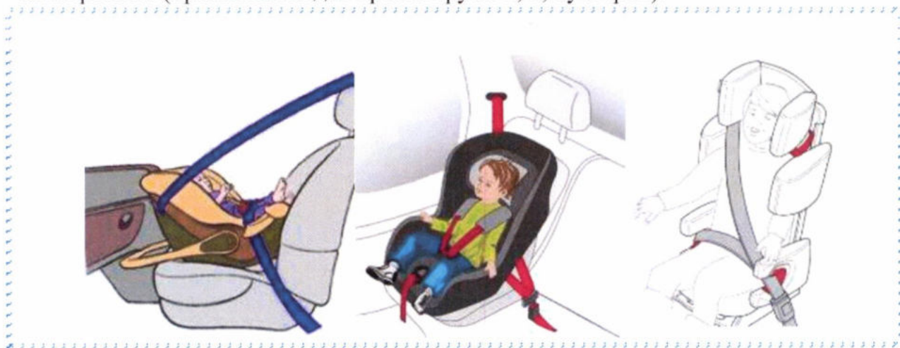
Рисунок 4. Крепление штатными ремнями безопасности

- фиксация ребенка ремнем безопасности автомобиля, вместе с детским автокреслом (применяется для кресел групп 2, 3, бустеров).