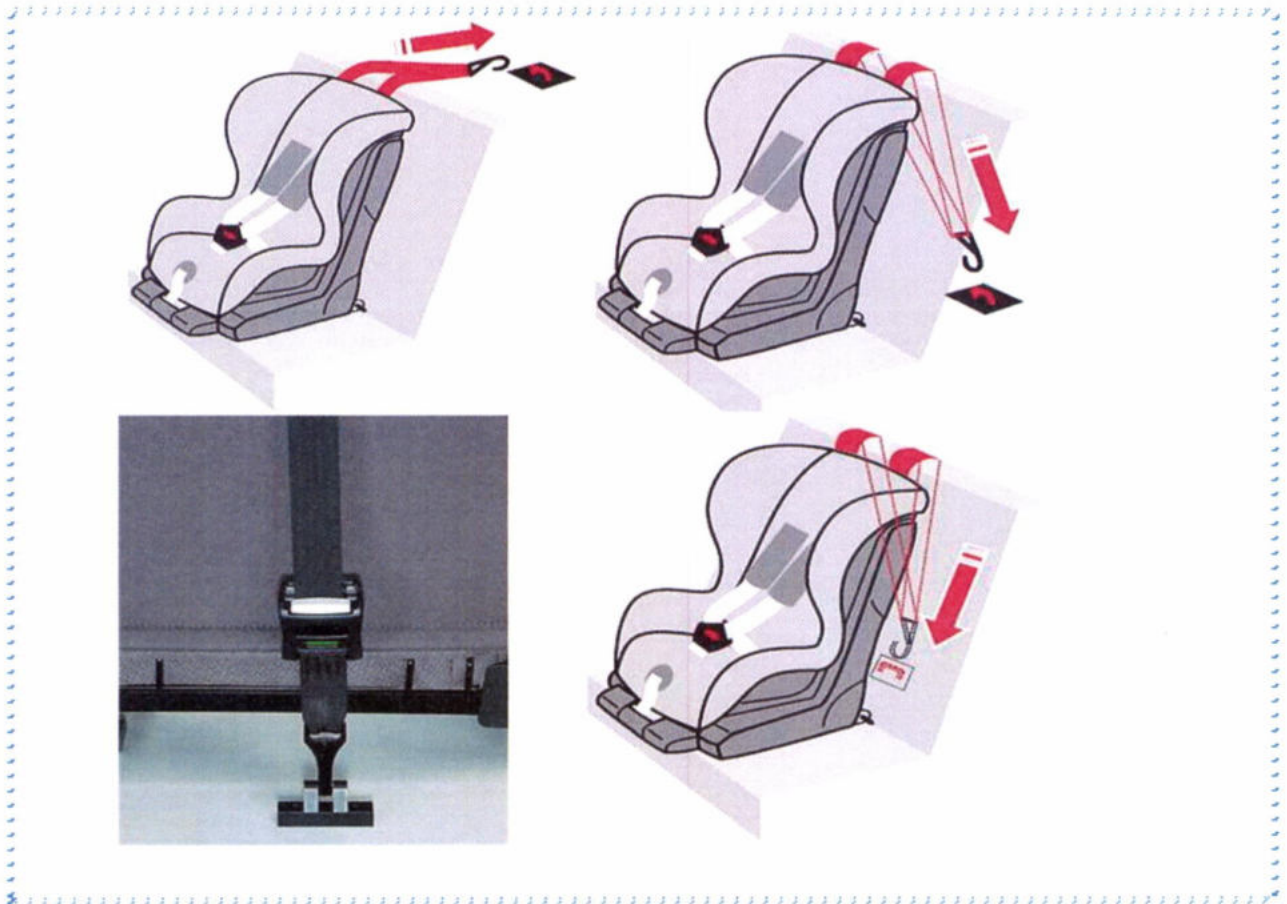
Рисунок 7. Способы фиксации якорного крепления

После того, как автокресло установлено, необходимо учесть ряд условий при усаживании в него ребенка.