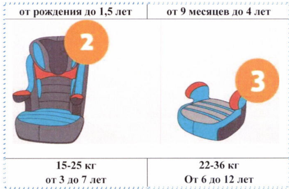
Рисунок 1. Виды детских удерживающих устройств.

Детские удерживающие устройства можно разделить по группам в зависимости от веса и возраста детей.