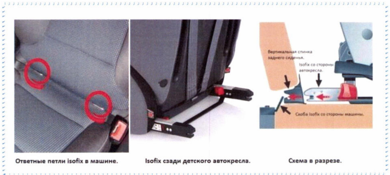
Рисунок 5. Крепления ISOFIX

Система крепления ISOFIX дает возможность быстрого и надежного крепления. За счет быстрозажимных устройств кресло надежно фиксируется и также легко снимается. Не приходится лишний раз беспокоить ребенка.